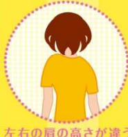
左右の肩の高さが違う